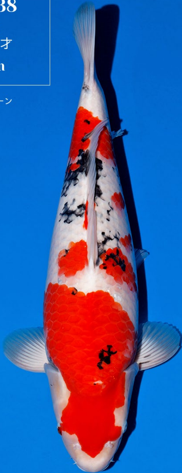
No.38 メス親 : パイナップルクイーン 57cm