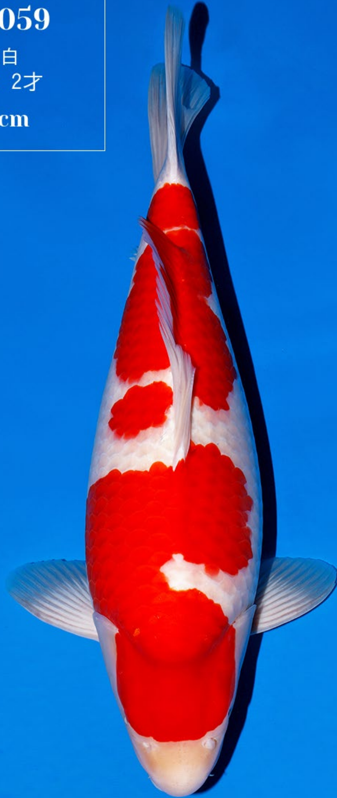
No.59 メス親：真子紅白 51cm