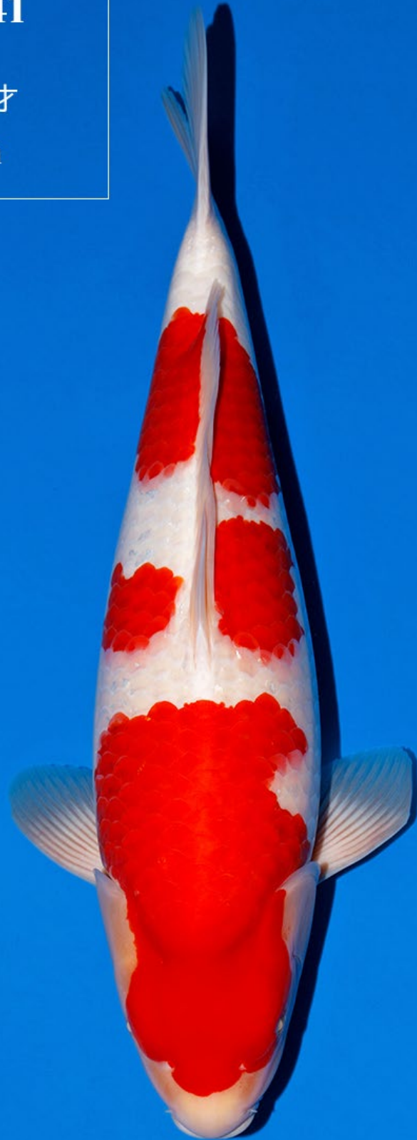
No.41 メス親：真子紅白 55cm