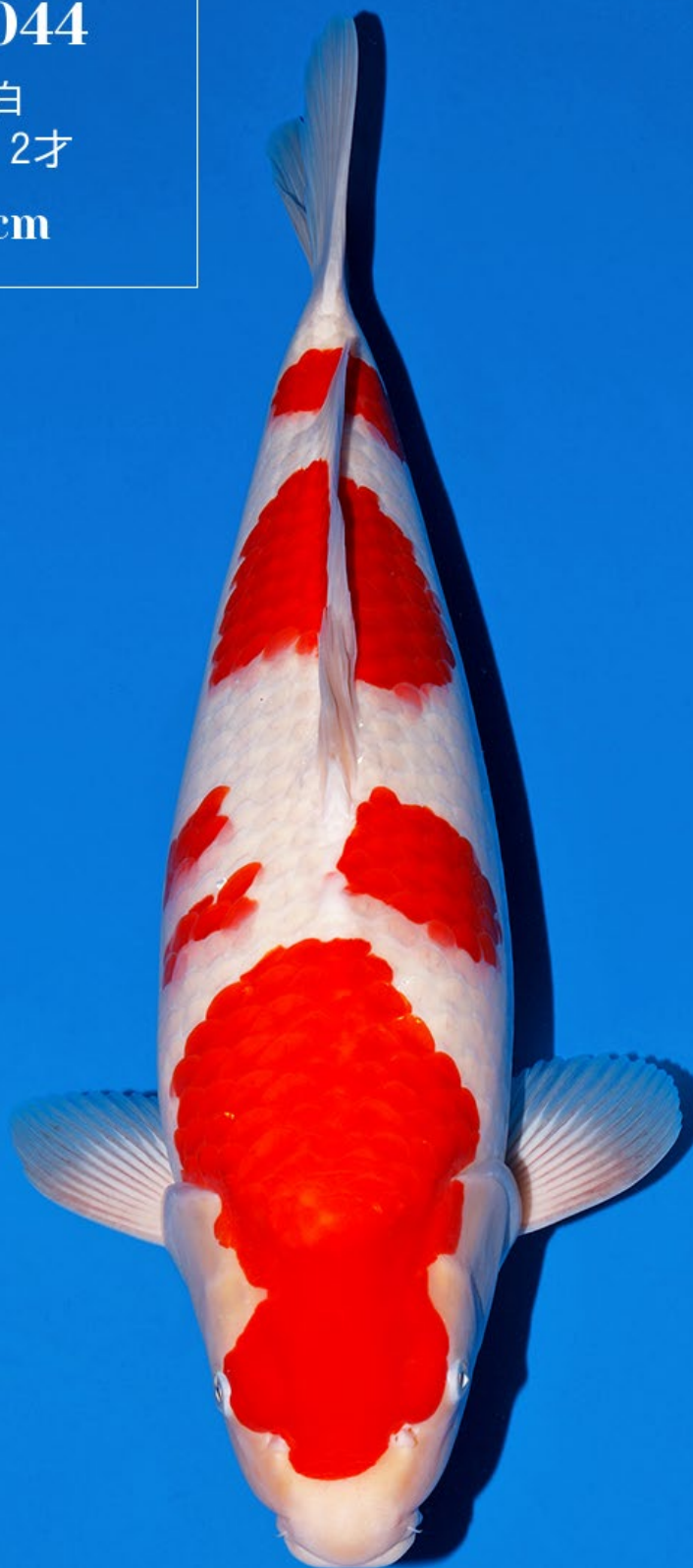
No.44 メス親：真子紅白 55cm